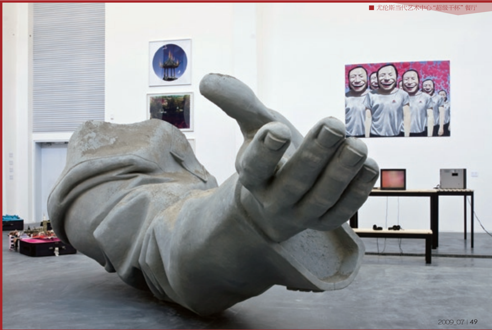
■ 尤伦斯当代艺术中心“超级干杯”餐厅

日前,UCCA已将大厅、咖啡厅等公共空间装点一新。观众在进入艺术中心的霎那,即会被浓浓的艺术氛围所包围,体验“艺术无处不在”的参观之旅。