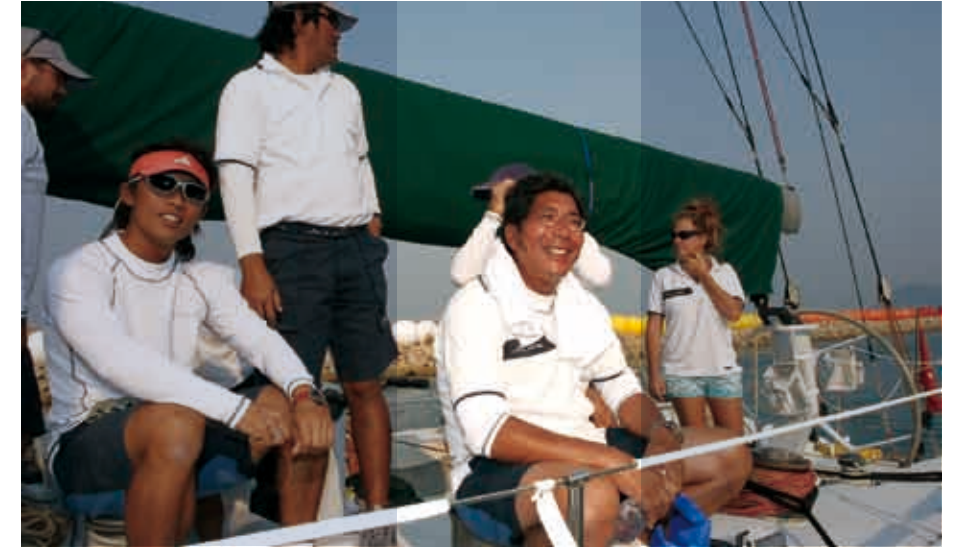
■每次与朋友出海，对于庞辉来说都是一次愉快的体验。

爱艇：喜欢刺激的人大可以像李泽楷一样选一条英国的Sunseeker游艇。Sunseeker是007最钟意的爱艇，是系列片中不可或缺的重要角色。李泽楷的Sunseeker Predator 80在海上能飚出42.5海里的极速，任谁都会大呼过瘾。