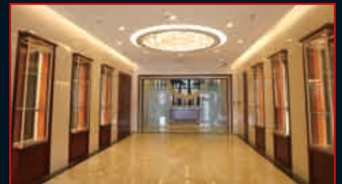
■通往财富中心的长廊。

舜井财富管理中心是工商银行在山东省设立的第一家财富管理中心，它依托工商银行强大的实力，以独树一帜的经营理念、顶级的舒适环境、熟谙现代金融的专业团队和安全私密的完美服务，为高端客户提供集私密性、专业化、个性化于一体的财富管理服务。在此基础上，该中心还提供贵宾通道、特惠商户、健康管理、高端论坛、私人助理等增值服务，可全面满足您的财富生活需求。（定制方案详见P68—P73）