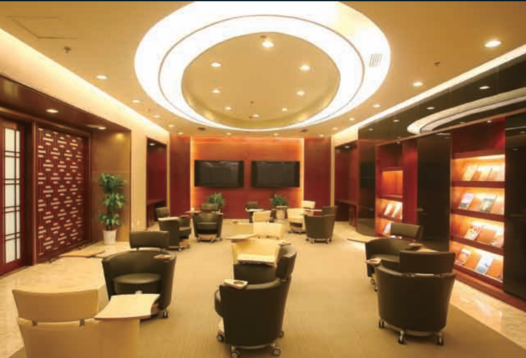
■宽敞的洽谈室搭配经典的黑白色椅子尽显舒适优雅。